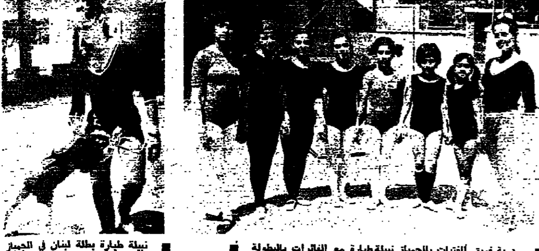
مدرسة فريق الفتيات بالجهاز ببطولة الفاترات...